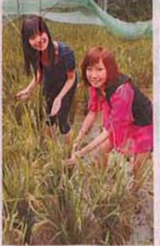
收割禾稻過程不難，男女老幼都適宜。