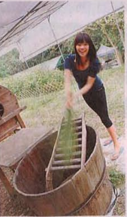
你有壓力嗎？不妨出盡全力打穀發泄吧！