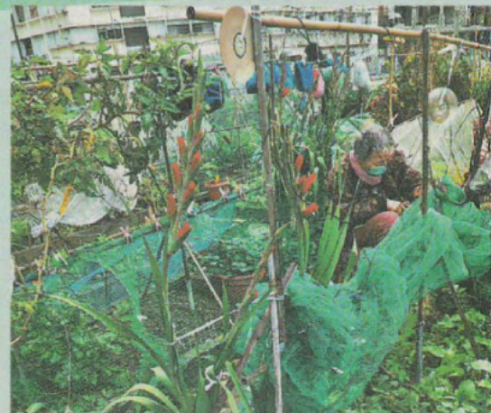
■張婆婆高興今年種植的劍蘭特別漂亮。