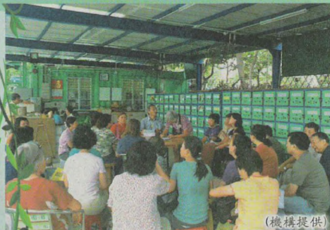
■很多長者對於園圃快面臨清拆，感到不捨。