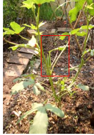
修剪後的秋葵橫枝迅速地長出果實