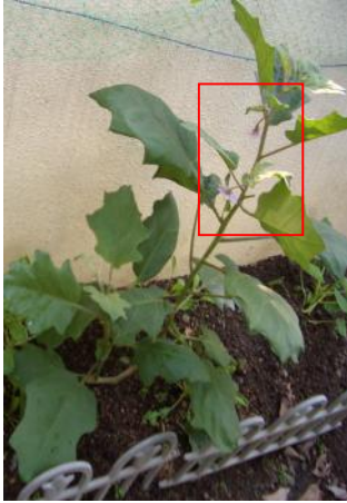
不翻土田上的茄子已長出兩朵花兒